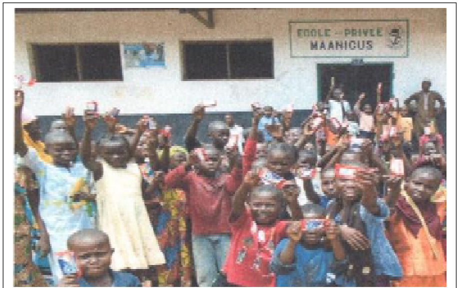
De school in Mobaye