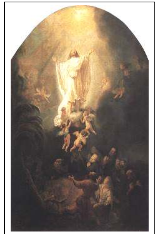
Rembrandt van Rijn

“Toen hij dit gezegd had, werd hij voor hun ogen omhooggeheven en opgenomen in een wolk, zodat ze hem niet meer zagen. Terwijl hij zo van hen wegging en zij nog steeds naar de hemel stardden, stonden er opeens twee mannen in witte gewaden bij hen. Ze zeiden: 'Galileeërs, wat staan jullie naar de hemel te kijken? Jezus, die uit jullie midden in de hemel is opgenomen, zal op dezelfde wijze terugkomen als jullie hem naar de hemel hebben zien gaan.'(Handelingen 1:9-11 NBV)